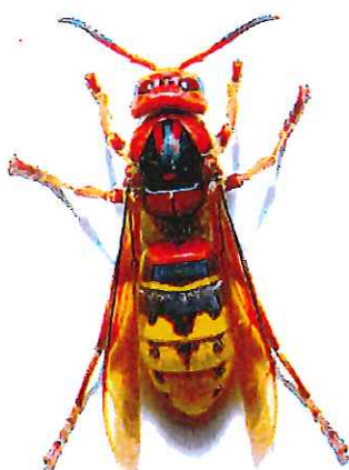
Frelon commun (jusqu'à 4 cm)

Depuis près de 15 ans, le frelon asiatique colonise la France et devient un véritable fléau pour la biodiversité et la santé publique.